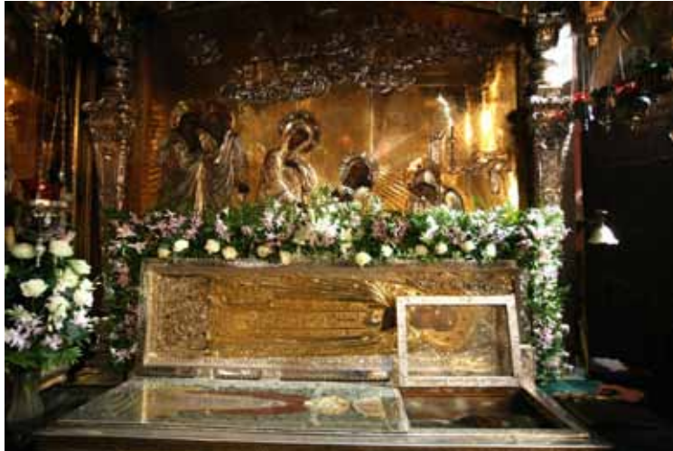
Рака с мощами прп. Сергия