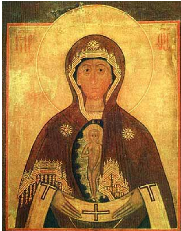
Торгинская икона Божией Матери

Секретарь сделал запрос и получил положительный ответ. Радостная весть о том, что опять будет праздник Пресвятой Богородицы «Торгинской» и, как в старые добрые времена, по полям с крестным ходом пойдут с чудотворной иконой, моля Бога о