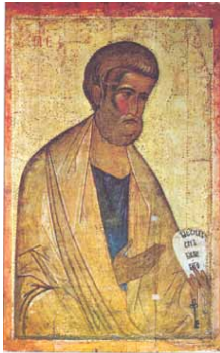
Первоверховный апостол Петр. Икона XIV в.

Согласно преданию, апостол Марк написал свое Евангелие для римских христиан со слов апостола Петра. Среди новозаветных священных книг есть два Соборных (окружных) послания апостола Петра. Первое Соборное Послание апостола Петра обращено к «пришельцам, рассеянным в Понте, Галатии, Каппадокии, Азии и Вифании» — провинциях Малой Азии. При-