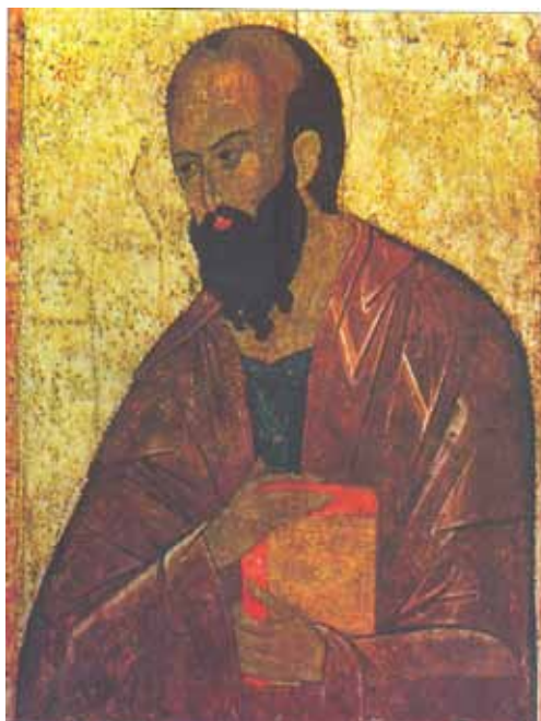
Апостол Павел Икона XIV в.

Последующее образование он получил в Иерусалиме, в славившейся тогда раввинской академии у знаменитого учителя Гамалиила, который считался знатоком